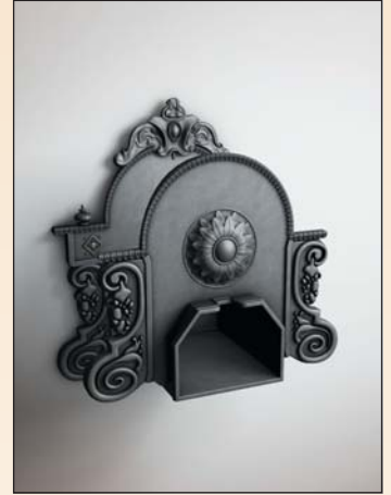
Schlauchhalter Hosepipe holder Art.Nr. 72.1905.045... H 45 cm, B 35 cm, T 21 cm