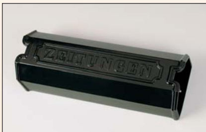
Zeitungsrolle Newspaper holder Art.Nr. 72.1455.015... L 42 cm, H 15 cm, T 10 cm

Alle Produkte sind handgearbeitete Qualitätserzeugnisse aus massivem Aluminiumguss, dunkelgrün, weiß, tief-schwarz oder antik anthrazit pulverbeschichtet. Gegen Aufpreis ist auch jede andere Farbe lieferbar.