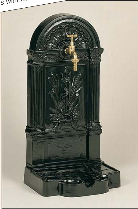
Standbrunnen Fountain Art.Nr. 72.1850.085... H 85 cm, B 42 cm, T 34 cm