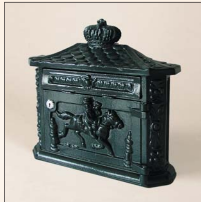
Wandbriefkasten, flach Flat wall mounted mail box Art.Nr. 72.1440.038... H 39 cm, B 38 cm, T 9,5 cm Einwurf / Flap: 26 x 3,5 cm