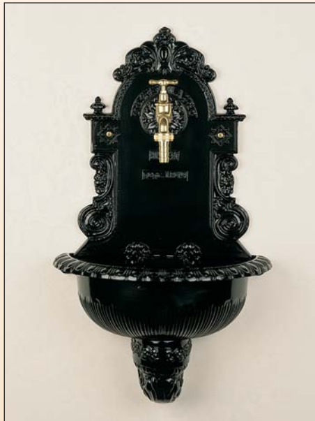
Wandbrunnen mit Einsatzgitter Wall fountain with gridiron Art.Nr. 72.1910.078... H 78 cm, B 46 cm, T 24 cm