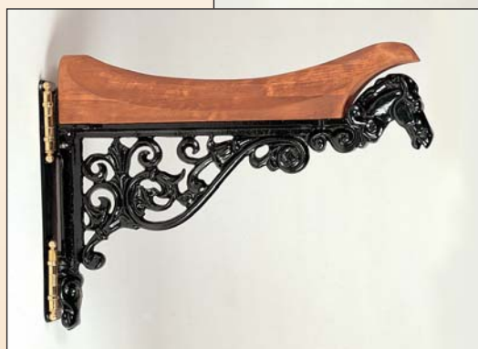
Sattelträger schwenkbar links Saddle holder swingable left Art.Nr. 72.2010.038..., H 38 cm, T 60 cm