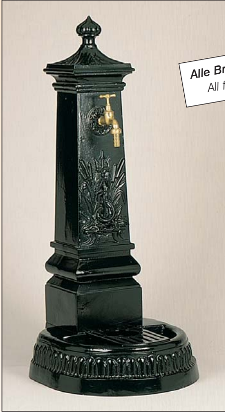
Standbrunnen Fountain Art.Nr. 72.1870.120... H 120 cm, B 56 cm, T 50 cm

Alle Brunnen mit Wasserhahn 72.1950.013.10 All fountains with water tap 72.1950.013.10