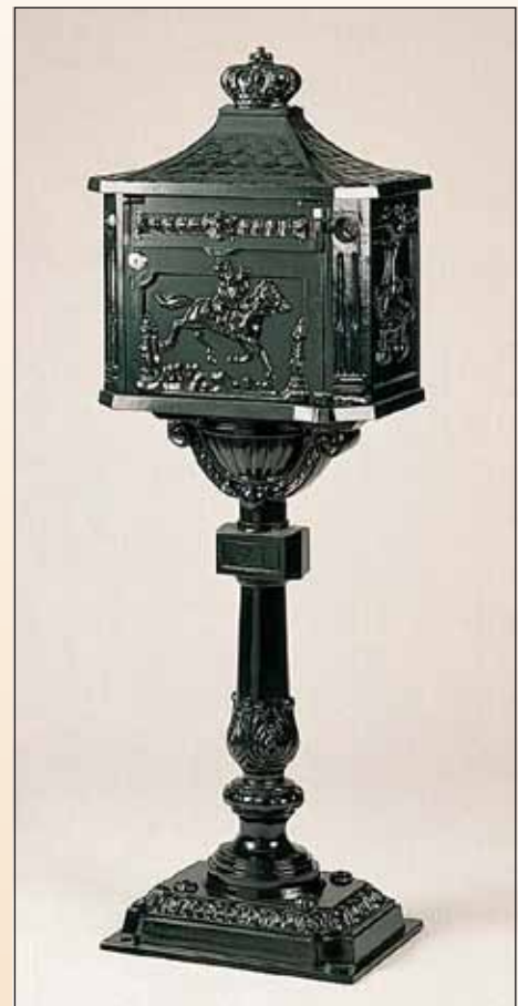
Standbriefkasten Post mounted mail box Art.Nr. 72.1420.114... H 114 cm, B 40 cm, T 28 cm Einwurf / Flap: 25 x 4 cm

Colours: Black, green, white and for a small extra cost anthracite.