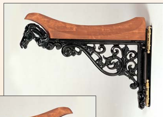
Sattelträger schwenkbar rechts Saddle holder swingable right Art.Nr. 72.2015.038... H 38 cm, T 60 cm