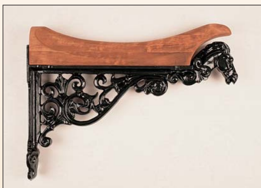
Sattelträger Saddle holder Art.Nr. 72.2000.038..., H 38 cm, T 58 cm