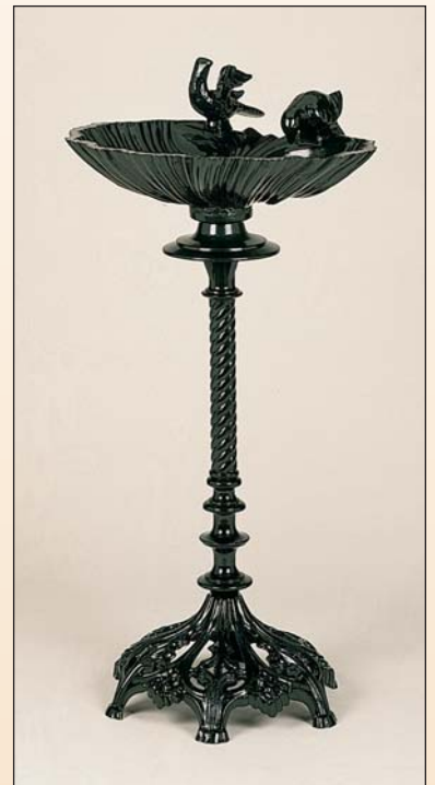
Vogeltränke Bird pool Art.Nr. 72.1500.095... H 95 cm, B 50 cm, T 45 cm