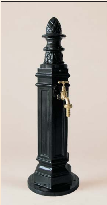
Poller mit Wasserhahn Bollard with water tap Art.Nr. 72.1890.094... H 94 cm, Ø 30 cm