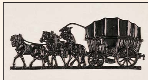
„Kutsche“ / „Coach“ Art.Nr. 72.2610.023..., 59 x 23 cm