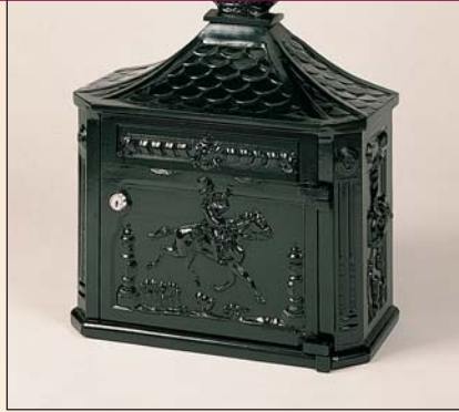
Wandbriefkasten Wall mounted mail box Art.Nr. 72.1450.047... H 48 cm, B 42 cm, T 21 cm Einwurf / Flap: 24,5 x 3,5 cm