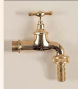
Wasserhahn Messing Brass water tap Art.Nr. 72.1950.013.10 13 x 15 x 2 cm

Colours: Black, green, white and for a small extra cost anthracite.