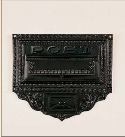
Mauerplatte für Briefschlitz Wall mounted mail box panel Art.Nr. 72.1470.035... H 35 cm, B 40 cm, T 5 cm Einwurf / Flap: 24 x 3 cm