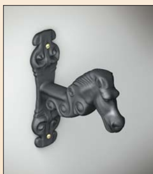
Zaumzeughalter Horse-gear holder Art.Nr. 72.2050.027... H 27 cm, B 8,5 cm, T 21 cm

Colours: Black, green, white and for a small extra cost anthracite.