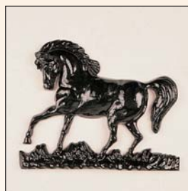
„Pferd“ / „Horse“ Art.Nr. 72.2625.034... 41 x 34 cm