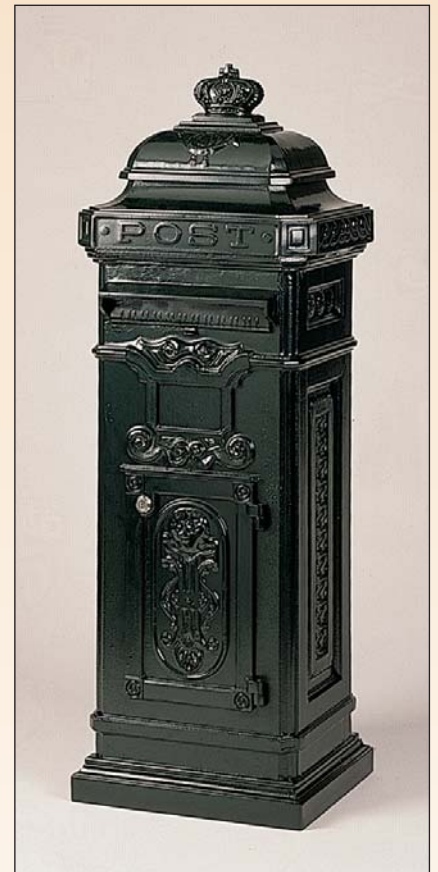
Standbriefkasten Mail box Art.Nr. 72.1410.125... H 105 cm, B 36 cm, T 33 cm Einwurf / Flap: 25,5 x 3 cm